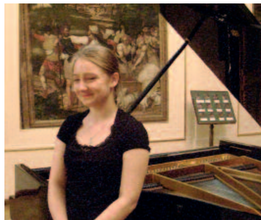
27.03.2010. 901 Wieczór lisztowski / 901 Liszt Evening.