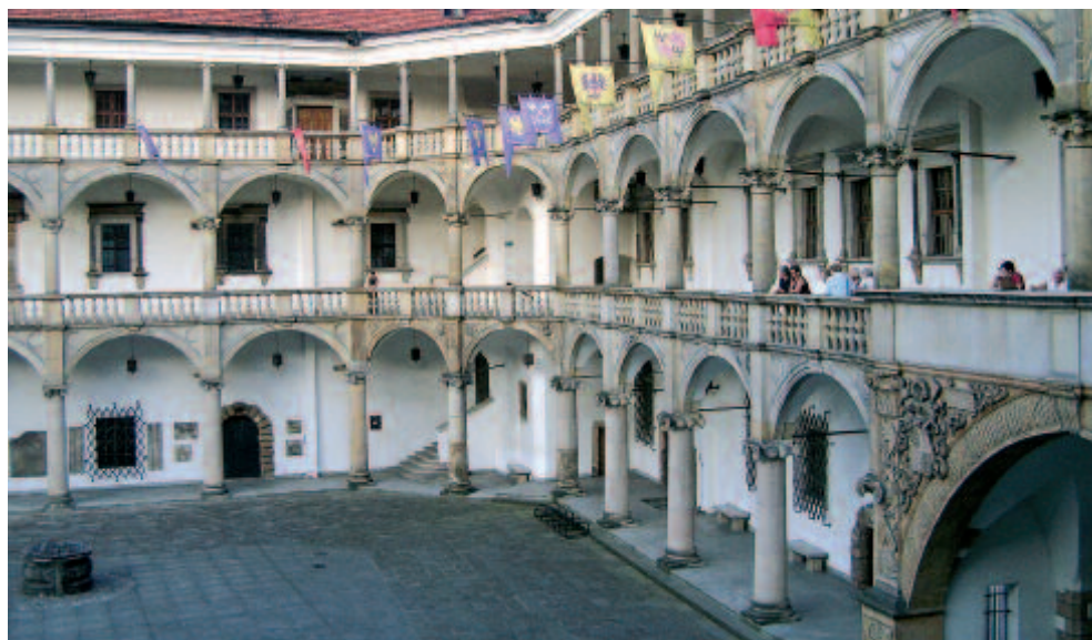
Dziedziniec Zamku Piastów Śląskich w Brzegu / Silesian Piast Dynasty Castle in Brzeg.