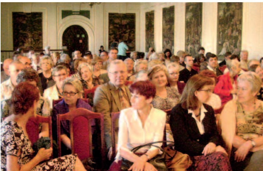
Thumnie przybyli słuchacze oczekują na rozpoczęcie koncertu. 25.05.2011. The hall is filled with audience. 25th May 2011.